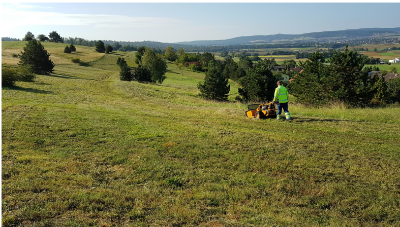
Abb. 13: Durchführung der Mahd vom Mitarbeiter der Marktgemeinde Hof am Leithaberge,