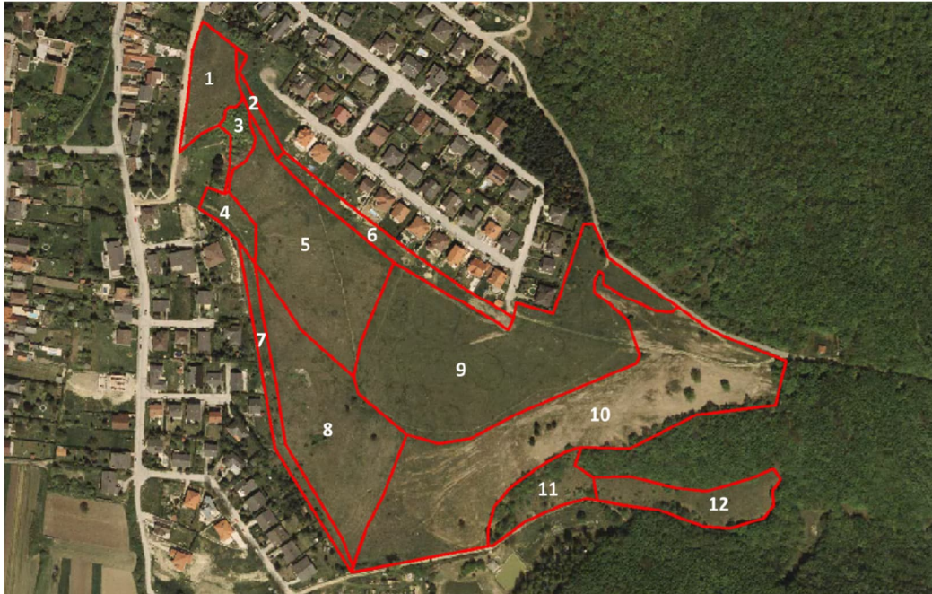
Abb. 5: Lage und Abgrenzung der Teilflächen für den Managementplan Gipfelberg.