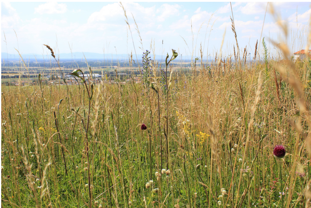
Abb. 6: Blick in den Pflanzenbestand des Trockenrasens am Gipfelberg in Hof am Leithaberge