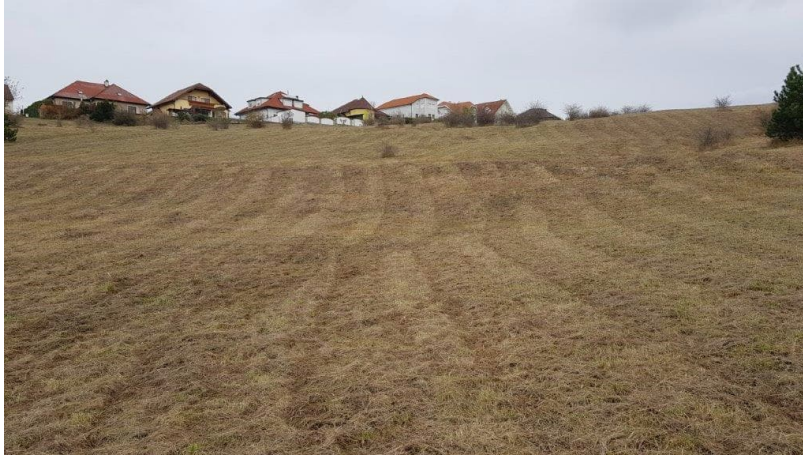
Abb. 10ff: Nach den Entbuschungsarbeiten mit dem Forstmulcher im Frühjahr 2019