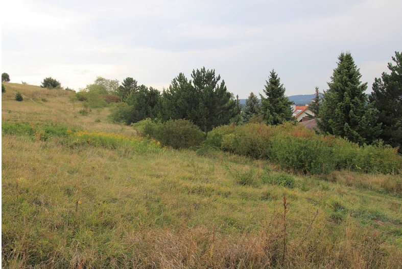
Abb. 12: Teilflächen 4 und 7 vor den Pflegemaßnahmen (Aufnahme am 10.09.2017 –)