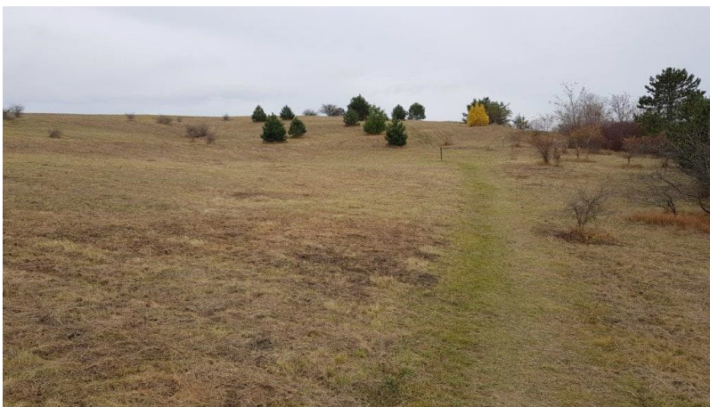
Abb. 9: Nach den Entbuschungsarbeiten mit dem Forstmulcher im Frühjahr 2019 (siehe auch nachfolgende Fotos)