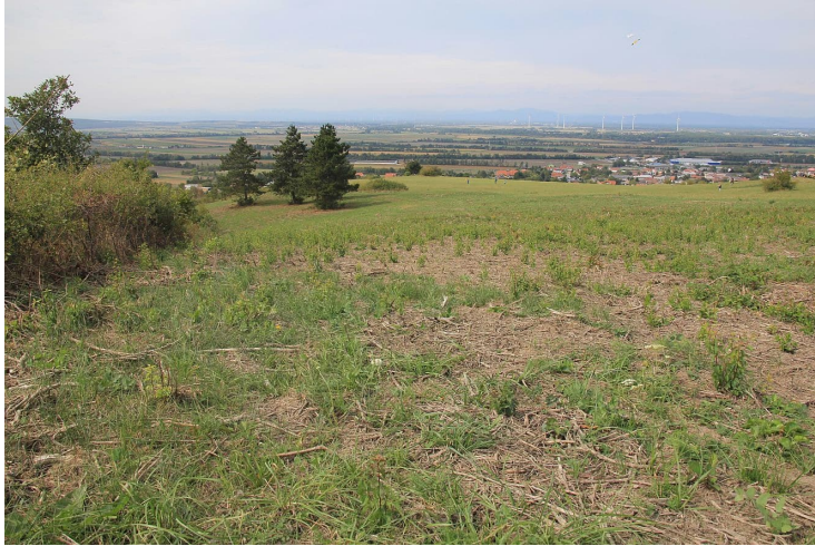
Abb. 7: Gehäckselte Teilfläche 10 (Aufnahmen am 10.09.2017 –)