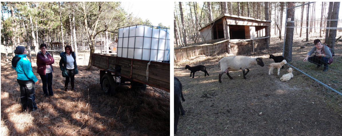
Abb. 4: Besichtigung des erfolgreichen Beweidungsprojektes in Linadabrunn durch die Arbeitsgruppe Hof am Leithaberge am 4.3.2017