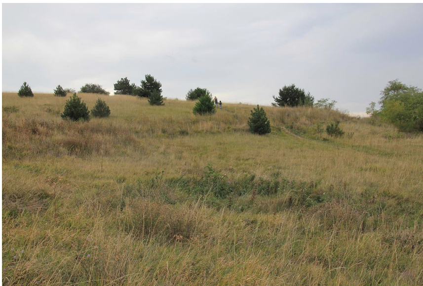
Abb. 11: Teilflächen 5, 7 und 8 vor den Pflegemaßnahmen (Aufnahmen am 10.09.2017 –)

Auf den Teilflächen 1 und 8 wird einmal im Jahr ab September nur 50% gemäht, damit seltene Arten wie die Bologneser Glockenblume ( Campanula bononiensis ) fruchten können. Bei der Teilfläche 2 erfolgt die Mahd einmal im Juli und ein weiteres Mal im Oktober. Im Zuge dessen werden aufkommende Gehölze teilweise händisch entfernt. Die Teilflächen 3, 4, 6 und 7 werden zweimal im Jahr gemäht, beginnend ab Juli. Die Teilfläche 5 wird nicht auf der ganzen Fläche, sondern nur zu ca. 80 % in einem Jahr gemäht. Die Teilfläche 10 wird fast zur Gänze einmal jährlich einer Mahd unterzogen. Etwa 10% in den Bereichen von Strauchwuchs werden für die Überwinterung von Schmetterlingsgruppen und Wildbienen belassen. Die Teilflächen 11 und 12 werden nicht gemäht, das weitere Vordringen von Gehölzen wird jedoch durch regelmäßiges Ausschneiden unterbunden. Der ebene Bereich 9 im Zentrum der Hutweide wird jährlich zweimalig vom ortsansässigen Landwirt im Rahmen eines landwirtschaftlichen Förderprogramms gemäht und das Schnittgut abgeführt (Abb. 11 bis Abb. 14).