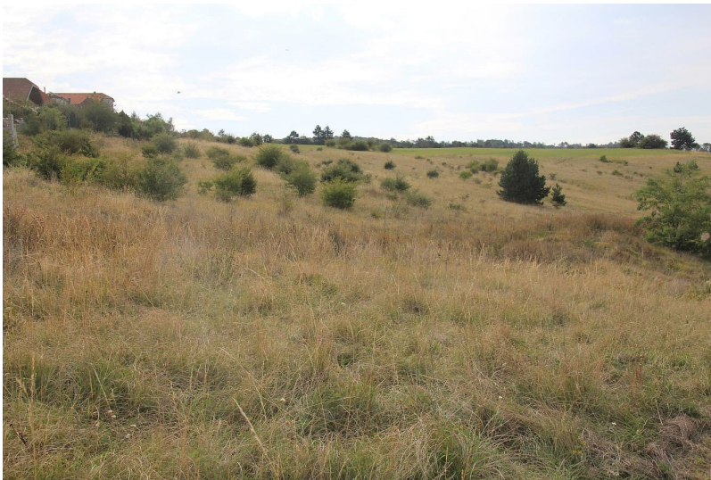
Abb. 8: Vor den Pflegemaßnahmen im Jahr 2017 (Aufnahme am 10.09.2017 –)

Im Frühjahr 2018 und 2019 wurden auf den Teilbereichen 2, 3, 6 und 10 am nördlichen und nordöstlichen Rand der Hutweide aufkommende Büsche, wie z.B. Weißdorn, Schlehdorn, Heckenrose, Brombeere etc. vor Vegetationsbeginn durch einen Landschaftspflegedienstleister mit einem Forstmulchgerät entfernt.