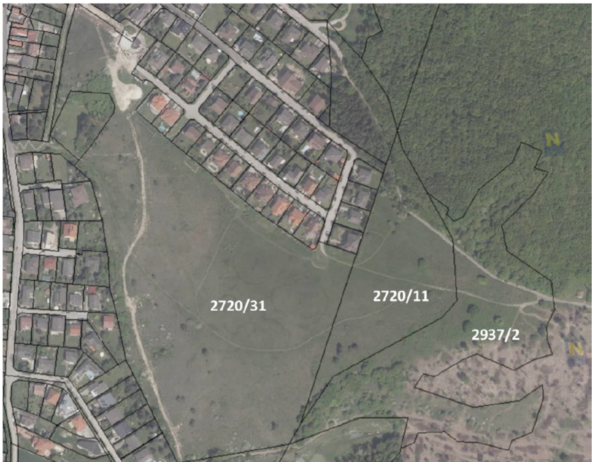
Abb. 1: Der Gipfelberg (rote Abgrenzung) mit drei Grundstücken im Eigentum der Gemeinde und der Agrargemeinschaft Hof am Leithaberge.