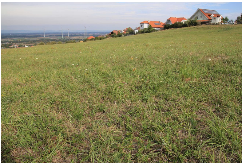
Abb. 14: Teilfläche 9: landwirtschaftlich genutzte Mähwiese (Aufnahme am 10.09.2017 –)