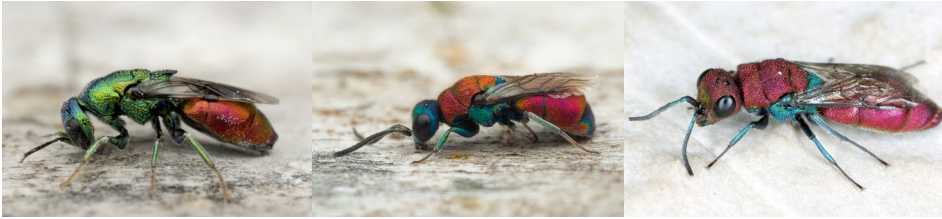
Abb. 28: Elampus sp., Chrysis chryso stigma , Chrysura cuprea (v.l.n.r.).

gefundenen Arten verteilen sich auf zwei Triben, Elampini mit den Gattungen Omalus , Elampus und Hedychridium und auf die Chrysididni mit Trichrysis , Chrysis und Chrysura . Gefunden wurden diese Arten auf den Trockenrasen, an Waldrändern, Mähwiesen sowie an Totholz.