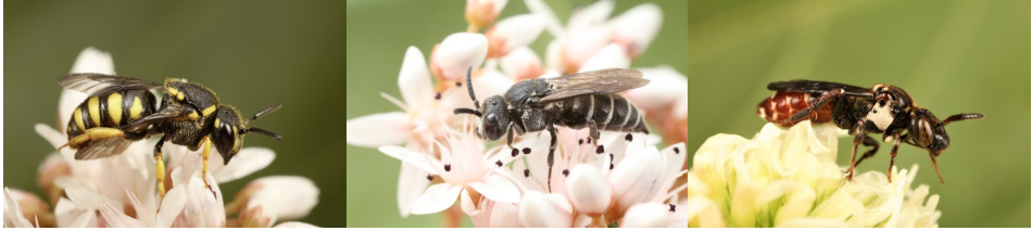
Abb. 27: Stelis signata , Aglaopis tridentata und Biastes emarginatus (v.l.n.r.).

nachgewiesenen Arten in nur vier Sammeltagen in den Leiser Bergen außergewöhnlich hoch. Grund dafür könnten die sehr vielfältigen Trockenstandorte mit diversen Strukturen und einer hohen Zahl an Blütenpflanzen in dieser Region sein.