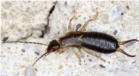
Abb. 12: Forficula auricularia .

Nach aktuellem Stand sind für Österreich 13 Arten von Ohrwürmern bekannt (MRKVICKA & SZUCSICH 2021). Von diesen konnte mit Forficula auricularia nur eine Art im Rahmen des ÖEG-Insektencamps für den Naturpark Leiser Berge nachgewiesen werden. Die Art ist österreichweit verbreitet und überall häufig und somit nicht gefährdet.