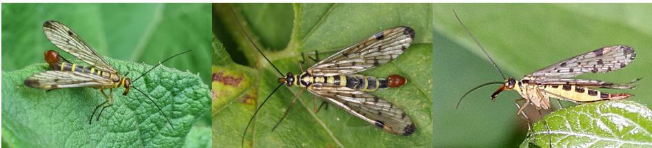
Abb. 23: Panorpa cognata (links) & Panorpa communis (beide rechts), Fotos: S. Koblmüller, G. Kunz & N. Szucsich.

Im Rahmen des ÖEG-Insektencamps konnten in verschiedenen Untersuchungsgebieten mit Panorpa cognata , Panorpa communis und Panorpa germanica drei Arten von Skorpionsfliegen (Panorpidae) nachgewiesen werden. Die letzten beiden Arten sind die häufigsten Vertreter der Familie in Österreich und kommen in einem breiten Lebensraumspektrum vor. Panorpa communis scheint vor allem feucht-kühle und schattige Tallagen und Bachgräben zu bevorzugen, ist aber auch in anderen Lebensraumtypen regelmäßig anzutreffen (GEPP 1979, 1982). Panorpa germanica kommt ebenfalls in einer Vielzahl an Lebensräumen vor, von feucht-kühlen Tallagen bis hin zu trocken-warmen Lebensräumen, sofern in der Nähe feuchte und beschattete Bereiche vorhanden sind (GEPP 1979, 1982). Panorpa cognata scheint etwas anspruchsvoller hinsichtlich des Lebensraums zu sein und bevorzugt eher wärmebegünstigte Standorte (GEPP 1979, 1982). Alle nachgewiesenen Arten gelten in Österreich als nicht gefährdet. Auch wenn für Nie-