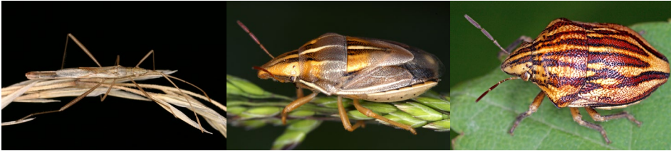
Abb. 17: Chorosoma schillingii , Odontotarsus purpureolineatus , Aelia rostrata (v.r.n.l.).

gefährdet. Weitere Besonderheiten des untersuchten Trocken-Graslandes sind die ebenfalls national gefährdeten Arten Odontotarsus purpureolineatus (Abb. 17), Lasiacantha hermani und Berytinus geniculatus (bestätigte Determination noch erforderlich). Die an Centaurea saugende Weichwanze Oncotylus viridiflavus ist ebenfalls gefährdet. Sie zeigt ein disjunktes Areal in Österreich. Es liegen wenige Funde aus Wien und nördlich von Wien sowie einige wenige Nachweise aus Vorarlberg vor. Bemerkenswert ist der Fund des Großen Spitzlings ( Aelia rostrata , Abb. 17), einer xerothermophilen Art sandig-trockener Biotope, die in Österreich als stark gefährdet gelistet wird.