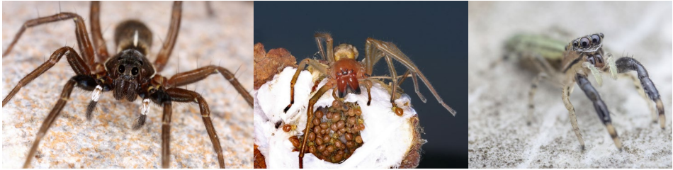
Abb. 33: Aulonion albimana , Cheiracanthium punctorium und Marpissa nivoyi (v.l.n.r.).