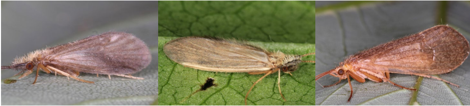
Abb. 25: Micropterna nycterobia , eine Art mit Imaginaldiapause im Sommer als Anpassung an intermittierende Bäche (links); Lepidostoma basale , eine Fließgewässer-Art mit Vorliebe für Totholz (Mitte); Crunoecia irrorata , eine typische Art sumpfiger Quellen (rechts), Fotos: O. Zweidick.