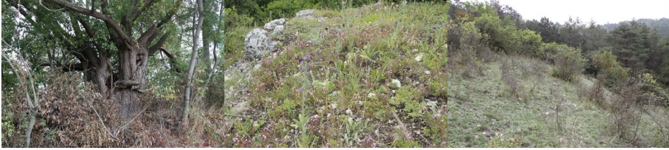
Abb. 7: Alte Baumbestände mit großen Baumhöhlen, Felsrasenvegetation, offene Halbtrockenrasen-Bereiche bei der Waldweide PF17.