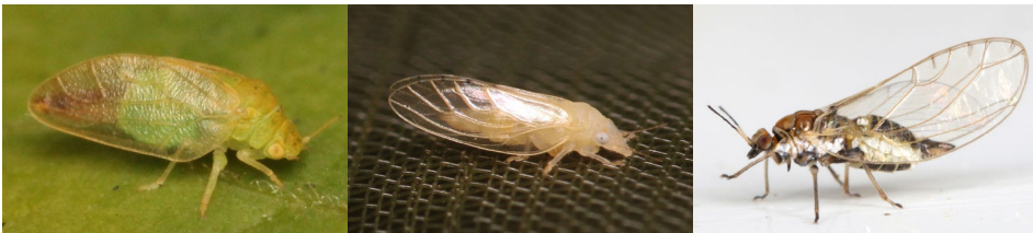
Abb. 20: Rhinocola aceris , Spanioneura fonscolombii , Trioza urticae .

Auf den Untersuchungsflächen wurden 8 Blattfloh-Arten erfasst. Besonders hervorzuheben ist der Gefleckte Buchsbaum-Blattfloh Spanioneura fonscolombii . Dieser lebt monophag ersten Grades an Buxus sempervirens (BURCKHARDT 2002) und ist neu für