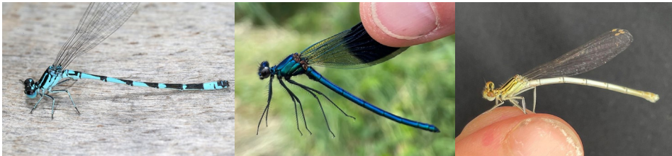
Abb. 14: Coenagrion ornatum , Calopteryx splendens , Platycnemis pennipes (v.l.n.r.).

Tab.3: Nachgewiesene Odonata (Libellen) im Naturpark Leiser Berge mit Angabe der Rote Liste-Kategorien, wenn vorhanden, und der Gesamtindividuenzahl. Rote Liste-Kategorien: DD/6 = Datenlage ungenügend, 5 = Gefährdungsgrad nicht genau bekannt, LC = ungefährdet, NT/V/4 = nahezu gefährdet (Vorwarnstufe), G = Gefährdung anzunehmen, VU/3 = gefährdet, EN/2 = stark gefährdet, R = extrem selten, CR/1 = vom Aussterben bedroht (RAAB & CHWALA 1997, RAAB et al. 2007).