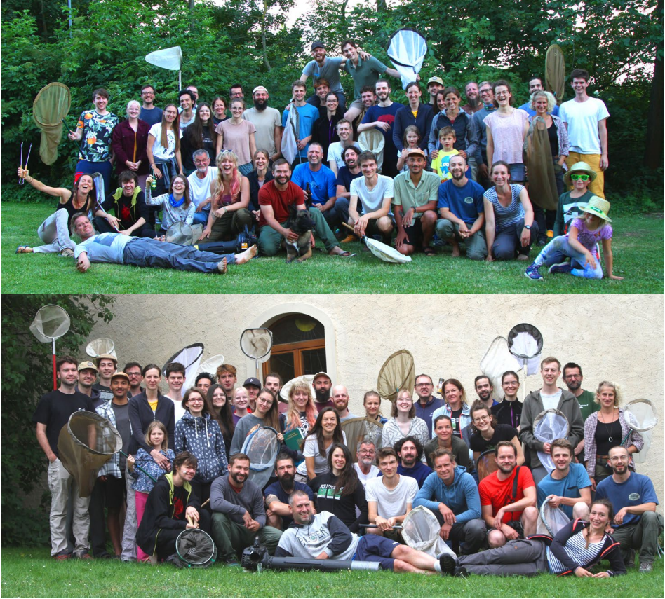
Abb. 1: Gruppenfotos der Mitwirkenden vor Ort beim achten ÖEG-Insektencamp im Naturpark Leiser Berge, Oberleis.

An den vier Exkursionstagen im Naturpark Leiser Berge nahmen 46 WissenschaftlerInnen und Studierende teil. Die vorliegende Arbeit leistet einen wichtigen Beitrag zur Datenerfassung der wenig bekannten Vielfalt der Insekten-, Spinnen-, und Weichtierfauna dieser speziellen Region.