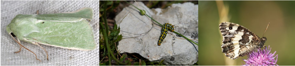
Abb. 26: Callamia tridens , Hyles euphorbiae und Brintesia circe (v.l.n.r.).

Tab. 13: Nachgewiesene Lepidoptera (Schmetterlinge) im Naturpark Leiser Berge mit Angabe der Rote Liste-Kategorien, wenn vorhanden, und der Gesamtindividuenzahl. Rote Liste-Kategorien: DD/6 = Datenlage ungenügend, 5 = Gefährdungsgrad nicht genau bekannt, LC = ungefährdet, NT/V/4 = nahezu gefährdet (Vorwarnstufe), G = Gefährdung anzunehmen, VU/3 = gefährdet, EN/2 = stark gefährdet, R= extrem selten, CR/1 = vom Aussterben bedroht (HUEMER 2007; HÖTTINGER & PENNERSTORFER 1999, 2005). Familien, Gattungen und Arten sind alphabetisch gereiht.