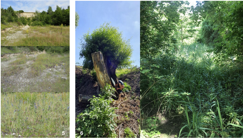
Abb. 5: Steinbruch auf Fläche PF14, Trockenrasen im Steinbruch. Abb. 6: Alter Kopfweidenbestand mit Totholz, Schilfbestand im Auwald charakteristischen Bereich.