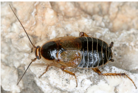
Abb. 13: Phyllodromica maculata .

Die Schaben sind eine artenarme Insektenordnung in Österreich. Die meisten für Österreich nachgewiesenen Arten sind eingeschleppt; nur sieben Arten kommen ursprünglich in Österreich vor (ZANGL et al. 2019a). Im Rahmen des ÖEG-Insektencamps konnten mit Phyllodromica maculata und Phyllodromica megerlei zwei autochthone Arten nachgewiesen werden. Auch wenn über die exakten Lebensraumsprüche der beiden Arten sehr wenig bekannt ist, scheinen beide Arten generell