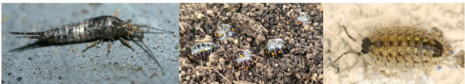
Abb. 32: Lepismachilis notata , Glomeris pustulata und Porcellio spinicornis (v.l.n.r.).

Leider ist unser Kenntnisstand in Österreich zu Verbreitung und Vorkommen bei vielen Organismengruppen sehr lückenhaft. Dies gilt insbesondere für viele Gruppen von Bodenarthropoden, insbesondere für primär flügellose Insekten und Myriapoden. Während Österreich in der ersten Hälfte des 20. Jahrhunderts noch zu den Hochburgen der Myriapodenforschung (STAGL 2003) zählte, fehlen Daten zur rezenten Verbreitung der meisten Arten weitgehend. Im Rahmen des Insektencamps konnten 2 Myriapoden-, 3 Landassel- und 2 Archaeognathenarten sowie eine Collembolenart dokumentiert werden. Dabei ist die Felsenspringerart Lepismachilis notata sehr erwähnenswert.