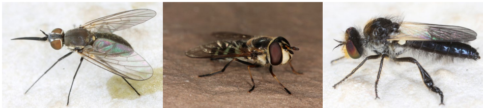
Abb. 24: Phthiria pulicaria , Didea alneti , Holopogon nigripennis (v.l.n.r.).

Aus der Familie der Schwebfliegen ist der Fund von Platycheirus sticticus besonders hervorzuheben. Ein einzelnes Exemplar wurde in der Gemeinde Pyhra auf einem kleinräumigen