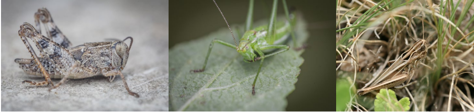
Abb. 15: Calliptamus italicus , Leptophyes albovittata , Stenobothrus lineatus (v.l.n.r.).

Tab. 4: Nachgewiesene Orthoptera (Heuschrecken) im Naturpark Leiser Berge mit Angabe der Rote Liste-Kategorien, wenn vorhanden, und der Gesamtindividuenzahl. Rote Liste-Kategorien: DD/6 = Datenlage ungenügend, 5 = Gefährdungsgrad nicht genau bekannt, LC = ungefährdet, NT/V/4 = nahezu gefährdet (Vorwarnstufe), G = Gefährdung anzunehmen, VU/3 = gefährdet, EN/2 = stark gefährdet, R = extrem selten, CR/ 1 = vom Aussterben bedroht (BERG et al. 2005).