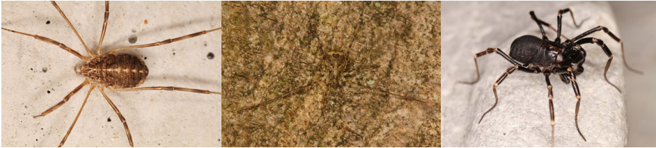
Abb. 34: Opilio saxatilis , Lacinius dentiger und Egaenus convexus .