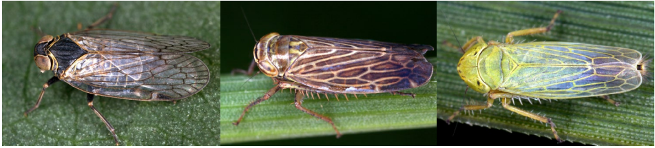
Abb. 19: Reptalus quinquecostatus , Paramesus major und Rhoananus hypochlorus (v.l.n.r.).

Hyalesthes philesakis , Kelisia confusa , Macropsis glandacea , Macrosteles variatus und Paramesus major , Arten von denen jeweils nur wenige Nachweise aus Niederösterreich bekannt sind. Oncopsis tristis war bisher durch historische Funde in Niederösterreich dokumentiert. Auf der Fläche PF17, einer mageren Waldweide, konnte hiermit ein rezentes Auftreten bestätigt werden. Sie gilt als mesophile Waldart und lebt auf Betula -Arten (MÜHLETHALER et al. 2018). Zudem erwähnenswert ist ein sehr starkes Vorkommen des Schilfbesiedlers Pentastiridius leporinus . Eine Art, die an fast allen besammelten Standorten dokumentiert werden konnte, selbst auf den trockensten Standorten, großteils mittels Leuchtschirms. Von naturschutzfachlicher Bedeutung sind nach der Roten Liste der Zikaden Österreichs (HOLZINGER 2009a) v.a. drei vom Aussterben bedrohte Arten, H. philesakis , P. major und Reptalus quinquecostatus . Diese xerothermen Arten wurden auf den mageren Halbtrockenrasen/Trockenrasen-Standorten (PF9, PF11 und PF12) gefunden. Zehn „stark gefährdete“ Arten, wie Cixidia pilatoi , Delphax crassicornis , Rhoananus hypochlorus und Platymetopius undatus konnten im Untersuchungsgebiet nachgewiesen werden. Acht weitere Arten gelten für Österreich als „gefährdet“, unter anderem die auf Trockenrasen und trockenwarmen Gebüsch lebende Dictyophara europaea und Diplocolenus frauenfeldi , welche ihre Verbreitung auf pannonische Trockenrasen, Säume und Wälder beschränkt (HOLZINGER 2009a).