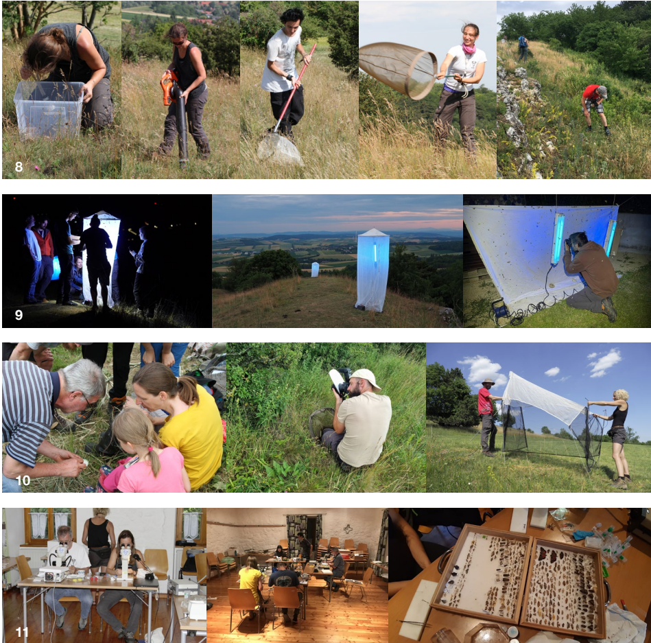
Abb. 8: Verschiedenste Sammelmethoden, wie Insektensauger, Landkescher und Handfang. Fotos: L.W. Gunczy, E. Huber & E. Papenberg. Abb. 9: Kontrolle der Leuchttürme in der Dämmerung und der Nacht und Fotodokumentation der Arten. Fotos: P. Schattanek-Wiesmair, M. Sonnleitner & G. Kunz. Abb. 10: Analyse & Erklärung des Tiermaterials, Fotodokumentation, Aufbau der Malaisefalle, Fotos: E. Huber & M. Sonnleitner. Abb. 11: Determination und Präparation des gesammelten Materials. Fotos: E. Huber & M. Denner.