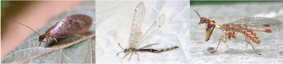
Abb. 21: Hemerobius stigma , Distoleon tetragrammicus , Mantispas styriaca . (v.l.n.r.).

und wird durch die trichterlose Lebensweise der Larven seltener nachgewiesen als die beiden häufigeren, trichterbauenden Arten Myrmeleon formicarius und Euroleon nostras (vgl. GEPP 2005b, GEPP 2010).