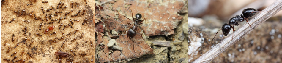
Abb. 29: Plagiolepis sp., Messor structor , Camponotus piceus (v.l.n.r.).

Österreich wurden bis 2002 122 Ameisenarten festgestellt, in Niederösterreich bis 2002 111 Arten (STEINER et al. 2002, SCHLICK-STEINER et al. 2003). Offene Landschaften sowie Randbereiche von Hecken und Waldbeständen weisen die höchste Vielfalt an Ameisen auf (SEIFERT 2018).