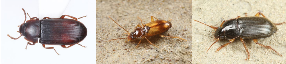
Abb. 31: Cynaenus angustus , Tachys fulvicollis und Parophonus hirsutulus (v.l.n.r.).

sind (GEIS 1995), wurde auf einer Waldweide (PF17) dokumentiert. Der wärmeliebende Kapuzenkäfer Lichenophanes varius , ein Besiedler abgestorbener Buchen und Eichen, kommt an mehreren Stellen im Gebiet vor (PF9, PF17, PF25).