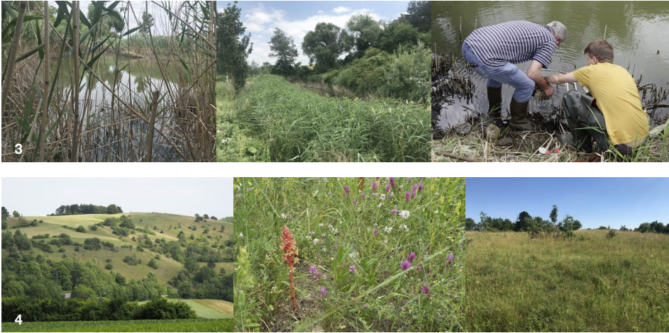
Abb. 3: Überblick des Landschaftsteiches PF26, Untersuchung des Uferbereichs mit Gesiebeprobe. Abb. 4: Blick auf Flächen PF9, 10 und 11, Halbtrockenrasen mit Orobancha elatior agg. und Melampyrum arvense .

wäre Fläche PF11 zu nennen. Die Fläche ist sehr artenreich, es wurden 66 Pflanzenarten dokumentiert. Die dominante Gräserart ist Bromus erectus , typische Untergräser wurden ebenfalls dokumentiert. Folgende krautige Pflanzen mit Gefährdungsstatus VU wurden notiert: Festuca valesiaca , Onobrychis arenaria , Pulsatilla grandis , Silene otites agg., Helianthemum nummularium , Melampyrum arvense . Orobancha elatior agg. und Primula major wurden ebenfalls nachgewiesen – diesen Arten wird der Gefährdungsstatus EN zugewiesen. Verbrachungstendenzen zeigen sich an den Rändern vor allem durch die Ausbreitung von Juniperus communis .