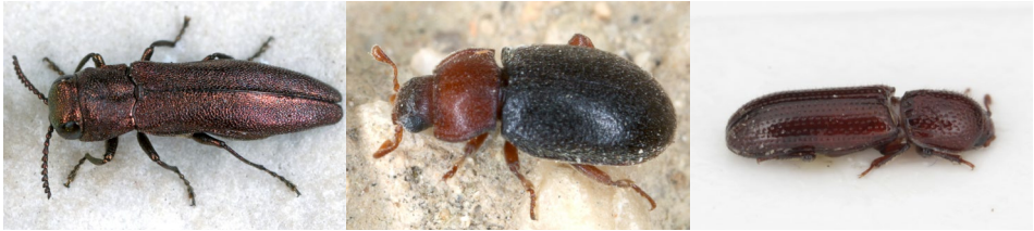
Abb. 30: Agrilus hyperici , Tetrabrachys connatus und Oxylaemus cylindricus (v.l.n.r.).

in Deutschland (schriftl. Mitt. H.-P. SCHNITZER) und der Schweiz (schriftl. Mitt. W. MARGGI) dokumentierte, offenbar rasante Ausbreitung der turano-mediterranen Art innerhalb Zentraleuropas durch weitere Beobachtungen im Naturpark Leiser Berge bestätigt werden. Wiederum gelangen die Nachweise mittels Lichtfang, weshalb wiederholt auf die Bedeutung dieser Methode im Rahmen von carabidologischen Untersuchungen hingewiesen wird. Im konkreten Fall sollte darauf geachtet werden, P. hirsutulus nicht im Gelände mit dem sehr regelmäßig am Licht zu beobachtenden Harplaus griseus zu verwechseln. Aus der Familie der Blatthornkäfer wurden 16 Arten nachgewiesen, wovon 10 Arten zur Gruppe der Dungkäfer (coprophage Scarabaeidae) gehören. Diese wurden auf der Schafweide unter der Aussichtswarte in Oberleis in Schafdung gefunden (PF13). Unter den anderen Arten, die allesamt mittels Lichtfang gefangen wurden, ist besonders Polyphylla fullo hervorzuheben. Diese Art ist auf sandige Böden, warme Standorte und Kiefern zur Nahrungsaufnahme angewiesen und wird in der tschechischen und deutschen Roten Liste gefährdeter Käfer in der Kategorie VU geführt (HEJDA et al. 2017, SCHAFFRATH 2021).