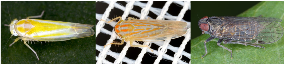
Abb. 18: Alebra coryli , Calamotettix taeniatus und Hyalesthes philesakis (v.r.n.l.).

Im Zuge des ÖEG-Insektencamps 2022 wurden 138 Zikadenarten nachgewiesen. Davon sind zwei Arten, die Hasel-Augenblattzikade ( Alebra coryli ) und die Rohrzirpe ( Calamotettix taeniatus ) neu für das Bundesland Niederösterreich. Von faunistischer Bedeutung sind die Funde von Batracomorphus allionii , Chloriona unicolor , Eurhadina kirschbaumi ,