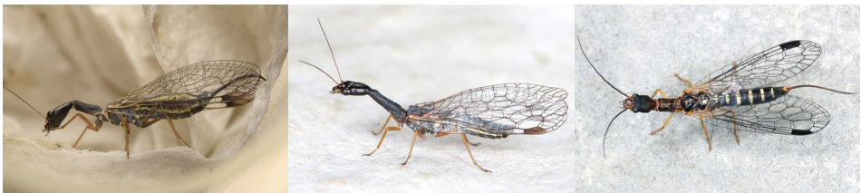
Abb. 22: Dichrostigma flavipes , Venustoraphidia nigricollis , Parainocellia braueri (v.l.n.r.).

Ein weiterer hervorzuhebender Fund ist Parainocellia braueri im Gebiet PF27. Im Gegensatz zu Vertretern der Raphidiidae besitzt diese Art keine Ocellen (namensgebendes Merkmal der Familie der Inocelliidae). Sie besiedelt wärmebegünstigte Niederungen (GEPP 2005b), wo Imagines vereinzelt angetroffen werden können (ASPÖCK et al. 1991).