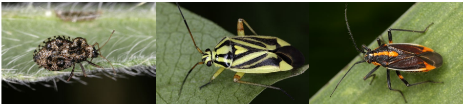
Abb. 16: Dictyla rotundata , Brachycoleus decolor , Horistus orientalis (v.r.n.l.).

Horistus orientalis (Abb. 16, Vorkommen in zwei Halbtrockenrasen-Standorten) kommt in Österreich ausschließlich in Niederösterreich nördlich der Donau vor und gilt als