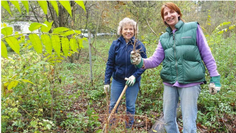
Viele Freiwillige machten sich an die Arbeit und gingen in der Stockerauer Au auf Götterbaum-Jagd. • Foto: naturschutzakademie.at • von Sandra Schütz

7. November 2018, 11:13 Uhr • 14x gelesen • 0