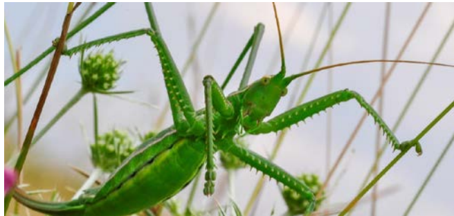
Sägeschrecke: © Werner Gamerith

Zielgruppe: Gemeindevertreter, Stakeholder