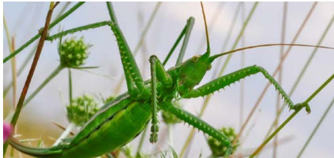
Sägeschrecke: © Werner Gamerith

Handlungsbedarf, Möglichkeiten der Erhaltung und Pflege