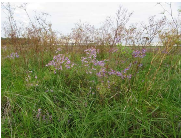
Salzlebensraum © Thomas Zuna-Kratky