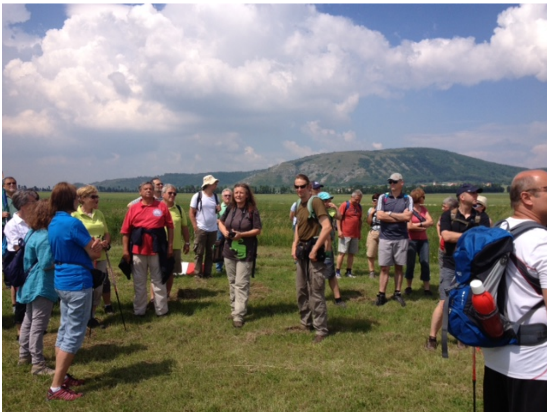
Exkursion Hundsheimer Berge

Die Pflegeweche in den Hainburger Bergen beinhaltet ebenfalls den wichtigen Aspekt der Bewusstseinsbildung. Pflegeeinsätze mit der Bevölkerung zählen zu den besten Möglichkeiten, den Schutz der Natur bei den Menschen zu verankern.