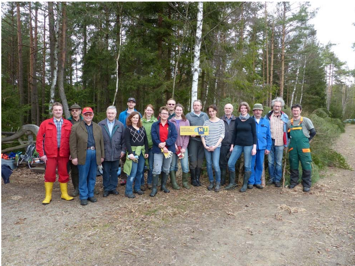
Pflegeeinsatz Heidenreichsteiner Moor

Ein zentrales Element im Schutzgebietsnetzwerk im Dienste des Informationsaustausches waren die Workshops in den Regionen. Diese waren allesamt gut besucht und haben den Bedarf in den Regionen an Möglichkeiten zum Austausch über Naturschutz-Maßnahmen aufgezeigt.