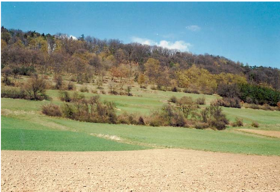
Wiesen im Bezirk Melk