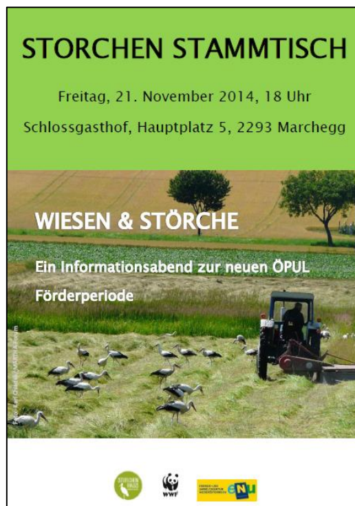
Plakat zur Bewerbung der Informationsveranstaltung

Um das Schutzgebietsnetzwerk Weinviertel bekannt zu machen und das Storchenhaus Marchegg als Anlaufstelle für naturschutzfachlichen Fragen in der Bevölkerung zu etablieren, wurde eine Informationsveranstaltung zum Thema „Wiesen und Störche“ organisiert. Das Thema gestaltete sich insofern interessant, da sich im Laufe der Schutzgebietsbetreuung zahlreiche Fragen seitens der Landwirte zur neuen ÖPUL Förderperiode abzeichneten. Der Weißstorch als „Flagship“-Art für bewirtschaftete Feuchtwiesen eignete sich zur Abrundung des Vortragabends. Zahlreiche Landwirte und Anrainer der March Auen besuchten am 21.11.2014 den ersten sogenannten Storchenstammtisch, wo Thomas Zuna-Kratky mit den Teilnehmer zum Thema Wiesenbewirtschaftung im Rahmen des Umweltprogramms ÖPUL diskutierte und Marion Schindlauer (Storchenhaus Marchegg) einen Kurzvortrag zur Weißstorch Brutsaison 2014 hielt.