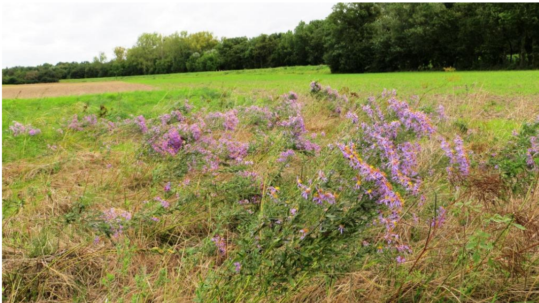
Vermehrter Aufwuchs der Grau-Aster nach dem Pflegeeinsatz – 23.09.2014