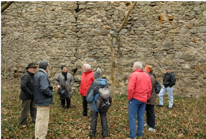
Begehung Dammgraben – 22.02.2014