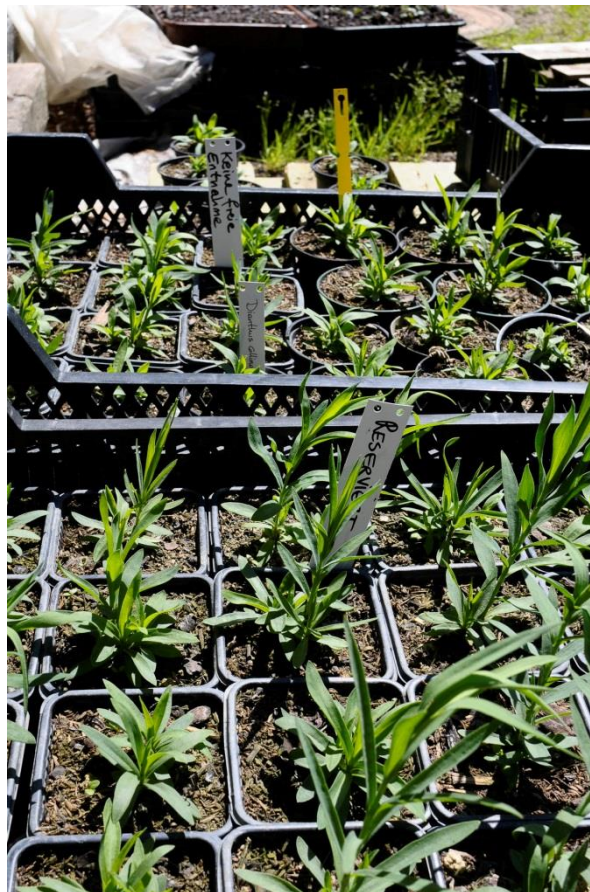
Nachzucht der Hügelnelke Dianthus collinus – 06.06.2014