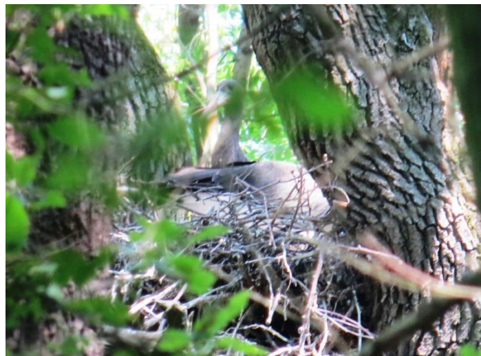
2 Jungstörche in der Nanni Au – 20.07.2014