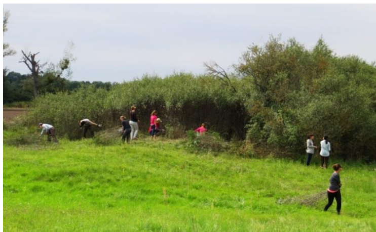
Rückschnitt der Schlehenhecke durch Freiwillige – 20.08.2014